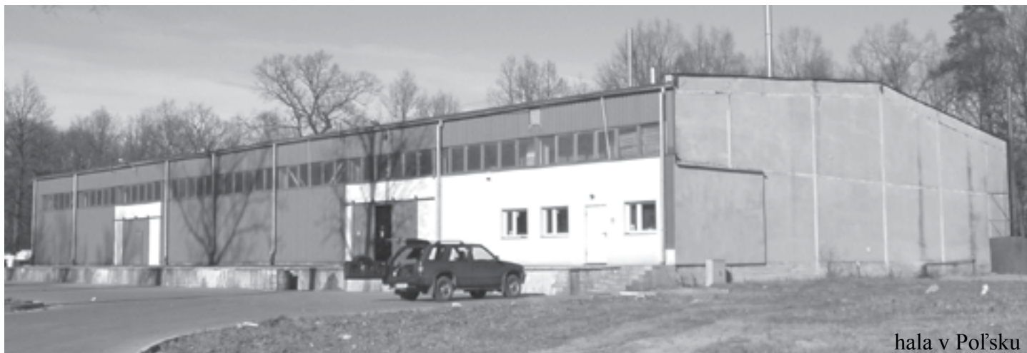
hala v Poľsku

Miestny spolok Červeného kríža ponúka mamičkám a ich ratolestiam pravidelné cvičenie na fit loptách a aerobik. Cvičíme v kultúrnom dome každý utorok od 18:00 hod. do 19:00 hod na fit loptách pod vedením Jany Vranovej a každý štvrtok od 18:00 hod do 19:00 hod. aerobik pod dohľadom Ľuby Hraníkovej. Cvičenie ponúkame grátis.