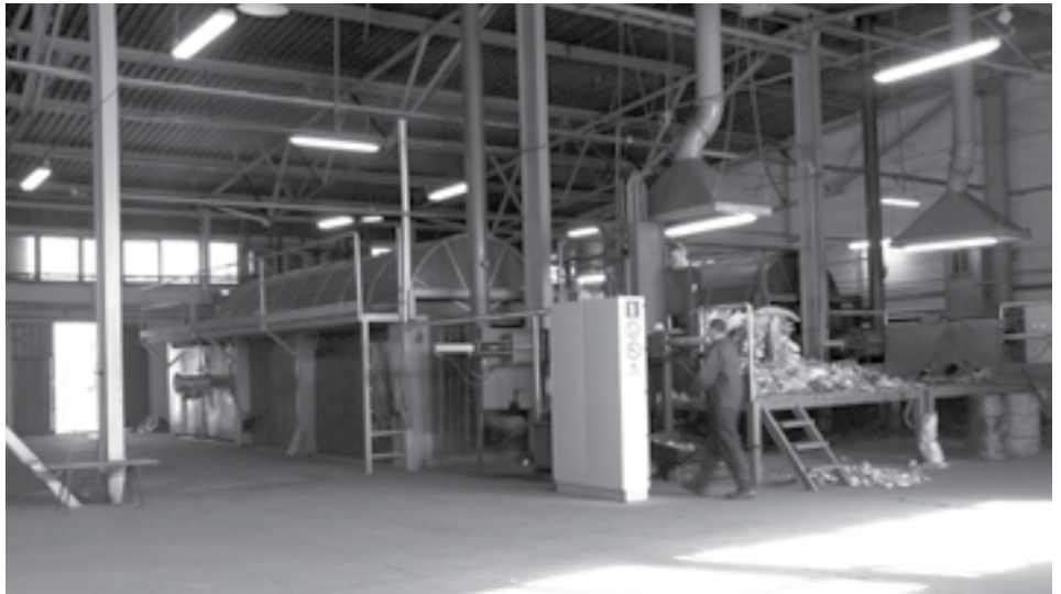
technológia v Pionkách

Technológia T-TECHNOLOGY® je unikátna technológia, ktorá používa technologický postup, založený na procese depolymerizácie, čiže na rozklade dlhých reťazcov plastových materiálov. Celý proces prebieha pri normálnom atmosférickom tlaku, pri teplote okolo 500 °C a za prítomnosti katalyzátora. Odborne sa takémuto procesu hovorí katalytické krakovanie.